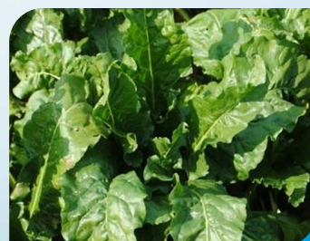
Z zastosowaniem Galileo 0,8 l/ha